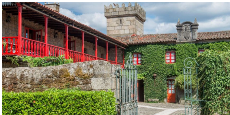
Casa Grande de Rosende

La Casa dos Muros es una antigua casa de labranza del S. XVIII ubicada en Pantón, único ayuntamiento bañado por los ríos Miño, el Cabe y el Sil. Siguiendo la estructura original de las antiguas casas de labranza, un precioso patio interior es que nos da acceso a la casa. Destaca en el exterior la zona de juegos con columpios, piscina y zona para barbacoa.