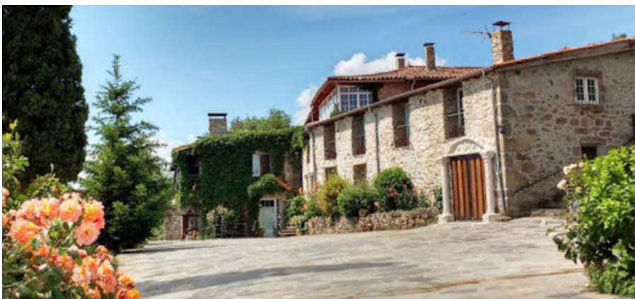
Casa dos Muros